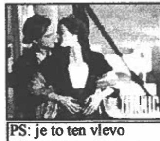
PS: je to ten vlevo

Vzkaz čtenářům: Pamatujte na slušné vychování!!!